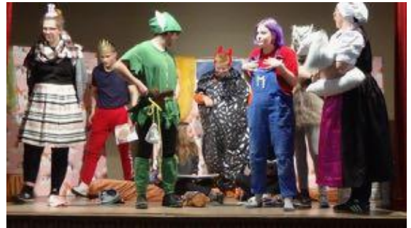
Bildtitel: Szene aus dem Stück