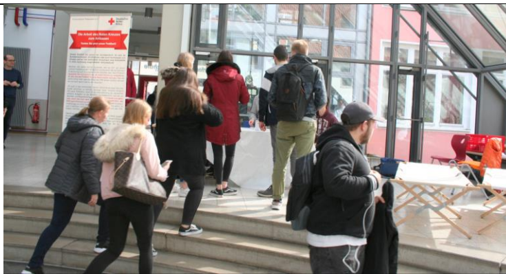
Bildtitel: Verkaufsstand für Waffeln